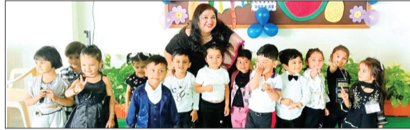
हरिभूमि न्यूज ► देवास

नए शैक्षणिक सत्र के पहले दिन सेन थॉम एकेडमी, भोपाल रोड और सेन थॉम पब्लिक स्कूल, बद्रिधाम नगर, देवास के प्री प्राइमरी छात्रों के लिए मजेदार यादगार रहा। शिक्षकों ने खुले दिल से छात्रों का स्वागत किया और नए सत्र की शानदार शुरुआत