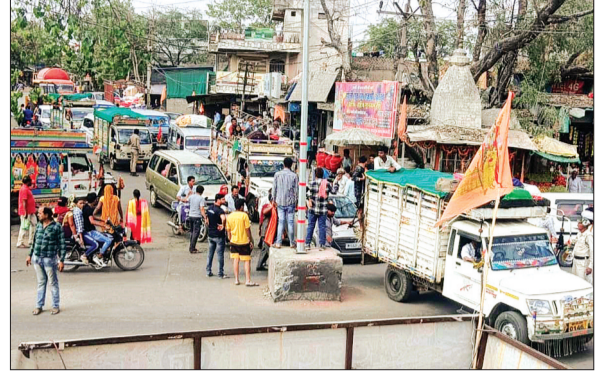
चापड़ा। चापड़ा चौराहे पर इस तरह लगता रहा जाम।