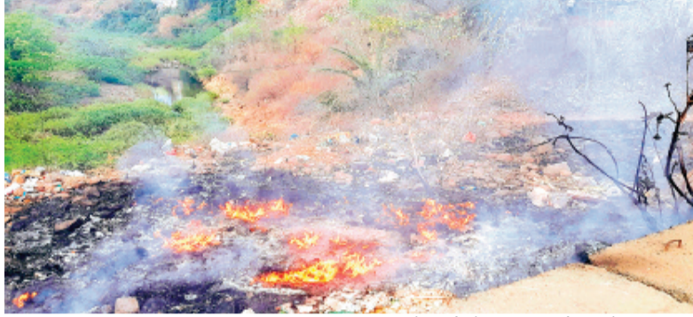
हरिभूमि न्यूज़ ▶▶ राजगढ़

स्वच्छ राजगढ़, सुंदर राजगढ़ की परिकल्पना के साथ नगर के विभिन्न वार्डों एवं मोहल्लों में नगर पालिका द्वारा प्रतिदिन साफ-सफाई करवाई जा रही है। लेकिन, नपा के स्वच्छता कर्मचारी कचरे के ढेरों को उठाने की मेहनत से बचने उसमें आग लगा रहे हैं।