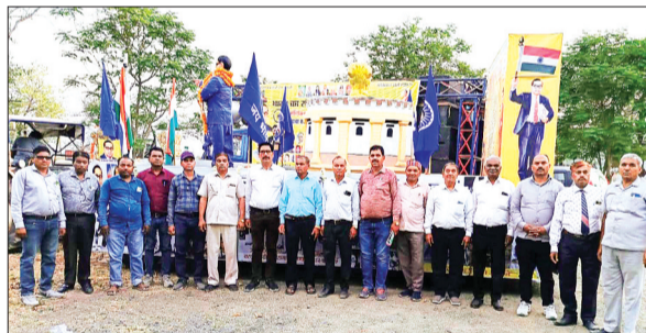
हरिभूमि न्यूज ► देवास