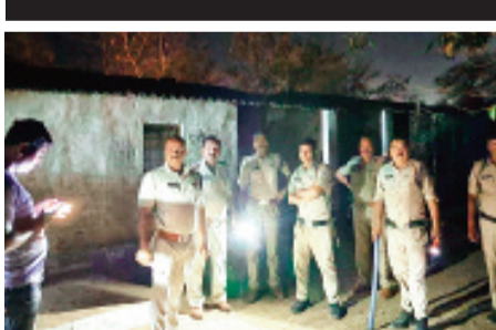
हरिभूमि न्यूज़ ▶▶ गुना